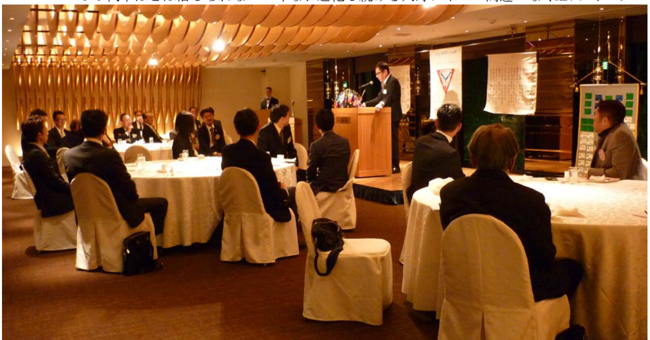
メンバー候補ゲスト6名 他クラブゲスト4名をお迎えした例会となりました